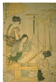
歌麿 女織蚕手業草