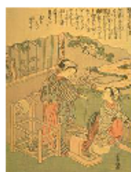
重政 かいこやしなひ草