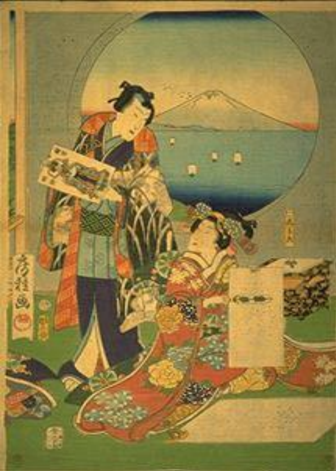
源氏蚕養草(げんじかいこやしないくさ) 歌川房種