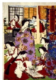
広重 女官養蚕之図