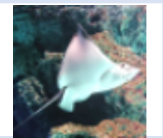
知能情報システム 工学学科 ASコース 4年 男性

こんにちは！応用化学専攻修士1年の学生サポーターです。 平日は有機化学の研究をしていて、休みの日は美味しいコーヒーを飲めるお店を探す旅に出かけてます。東小金井に住み始めて早くも4年が経ちますが、新しいお店やこんなところにあるんだみたいなお店が結構あるので、空きコマとかで時間がある時に大学の周りを散策してみると意外と新たな発見があるかもしれないですよ！