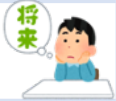
機械システム 工学専攻 修士2年 男性

新年度が始まってから早くも1ヶ月。五月病などと呼ばれる独特の気だるさを感じるようになってきましたがいかがお過ごしでしょうか？工学部の学園祭も近づき、中間テストも同様に近くなってきています。5月号では学習相談室のメンバーを紹介していこうと思います。