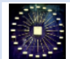
応用化学科 4年 女性

知能情報システム工学学科ASコースの4年生です。趣味は楽器の演奏です。気付いたらピアノ、ドラム、ギター、ベースに手を出していました。 学科の履修に関することからレポートの書き方まで、皆さんのキャンパスライフをともに考え、支えていきたいと思っています。 工学部周辺で一人暮らしをしているので、一人暮らしならではのご相談もお答えできます。 お一人でも、お友だちと一緒にでも、お気軽にお越しください！