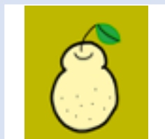
化学物理 工学学科 物理コース 3年 男性

応用化学科の2年生です。高校までは運動部でしたが、大学では管弦楽団に入り、バイオリンに挑戦しています。音楽経験がゼロだった分大変なこともたくさんありますが、新しい世界に触れると見えてくるのが沢山あって楽しいなと感じています。 好きな科目は有機化学です。教科書の使い方や勉強の仕方など、質問いただければ答えられることも多いと思いますので、是非気軽に質問にいらしてください。