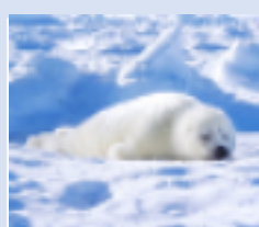
生命 工学学科 4年 女性

こんにちは。私は生体医用システム工学学科の4年生で、学園祭実行委員会に所属しています。 「第1回皐楓祭」の準備をしており、今年は小金井キャンパスでの対面開催となります。様々な企画やステージ発表、模擬店などを用意していますので、ぜひご来場ください。 私自身は樗寮で一人暮らしをしており、学校周りの情報について詳しいと思います。履修や授業内容、研究室のことなど、いろいろな相談にお答えできますので、気軽にお越しください。