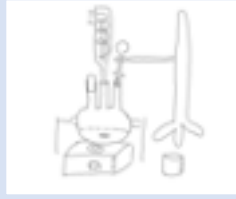
応用化学専攻 修士1年 男性

機械システム工学専攻修士2年です。出身は韓国ですが、jpopが好きです。あいみょんとかよく聞きます。 M科のことなら、履修登録、授業（数学、Python等）、課題など、色々アドバイスできるので、是非気軽に声かけてください！ M科のこと以外でも、就職活動に関する質問にも対応できます。IT大手から内定をいただいている、この経験からのアドバイスが皆さんのお役に立てれば嬉しいです！