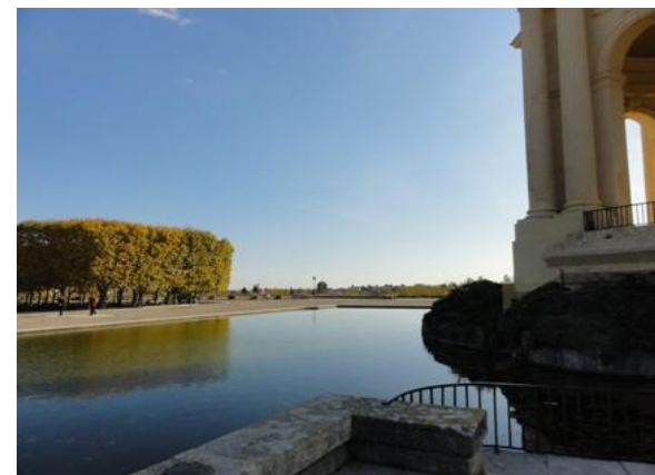
モンペリエ、凱旋門近くの広場