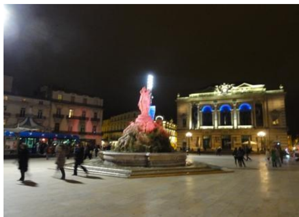
夜のモンペリエ、コメディイェ広場