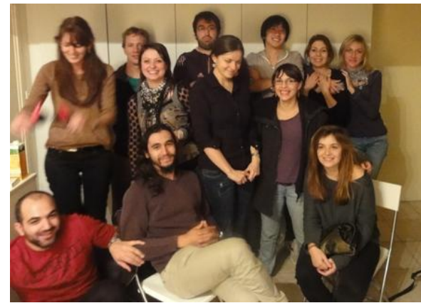
お世話になったラボメンバーと