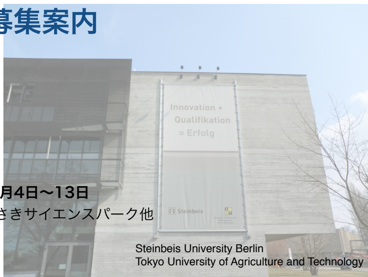
Steinbeis University Berlin Tokyo University of Agriculture and Technology