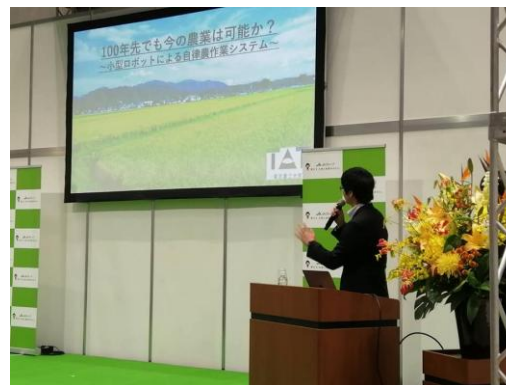
アグリビジネス創出フェアでの講演

志のある方は、ぜひ農工大の先生方にアポイントを取り、実際にキャンパスへ足を運んで直接お話ししてみてください。そして、農工大での挑戦を検討していただければと思います。