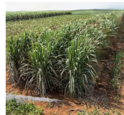
サトウキビの3Dモデル